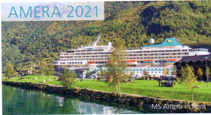
MS Amera in Håm