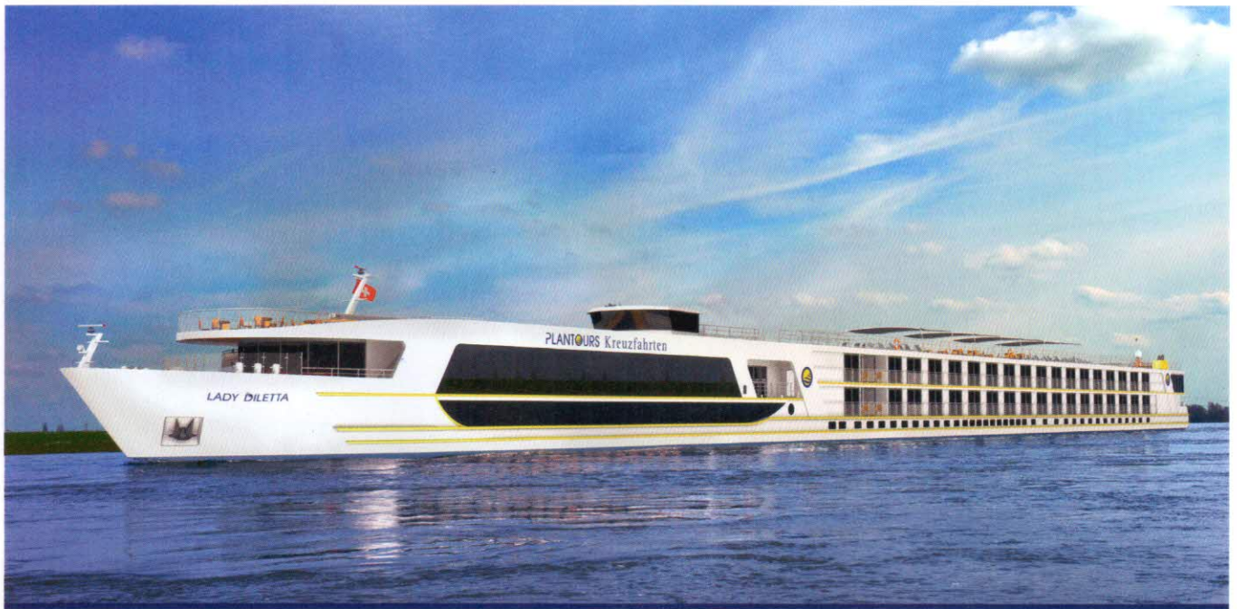
Modellansicht unseres Neubaus