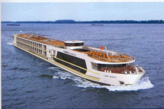
Modellbild von außen