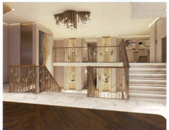
Modellbild der Treppe im Lobbybereich