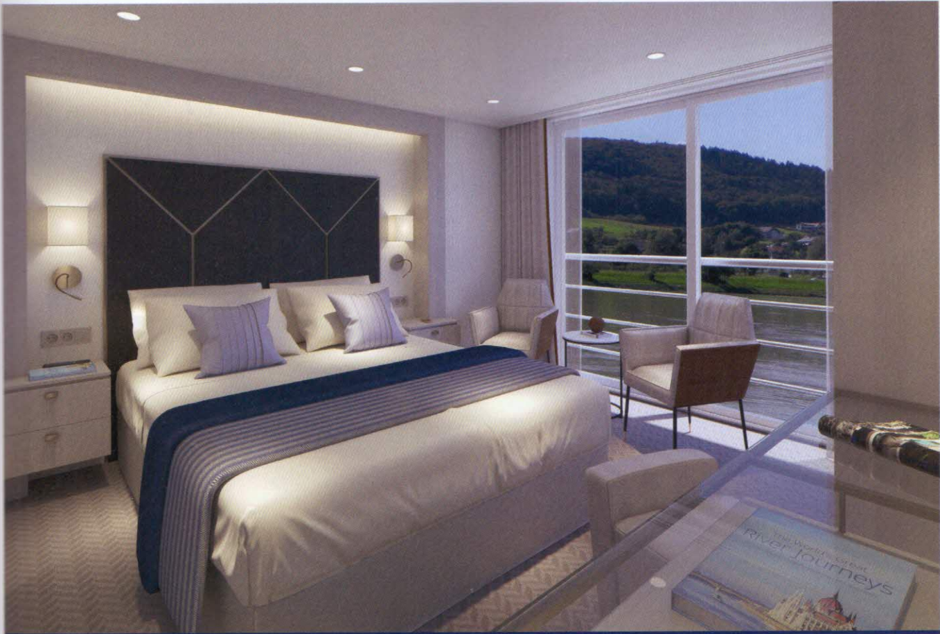
Modellbild einer Kabine mit französischem Balkon